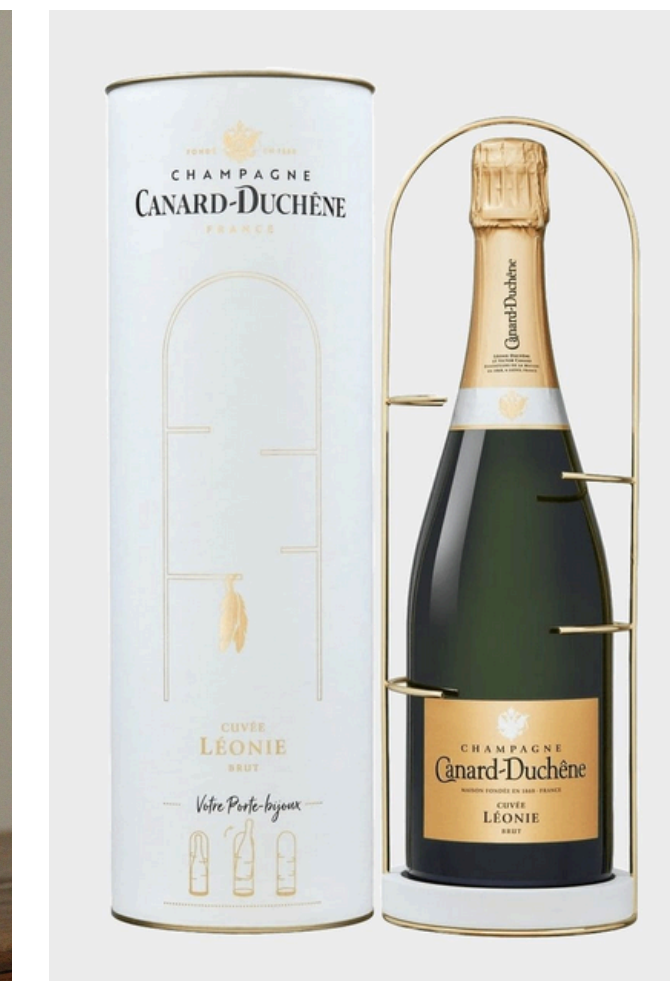
Carton, céramique et métal