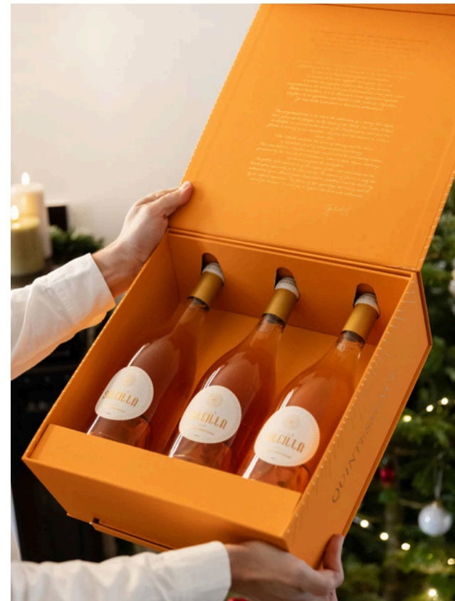
Coffrets carton Fabrication Européenne