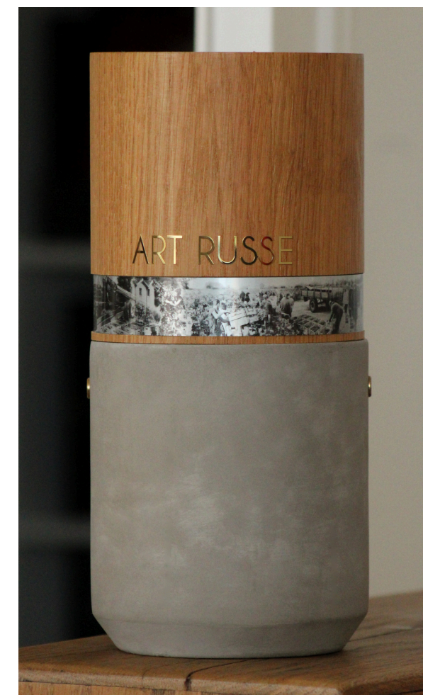
Chêne et béton