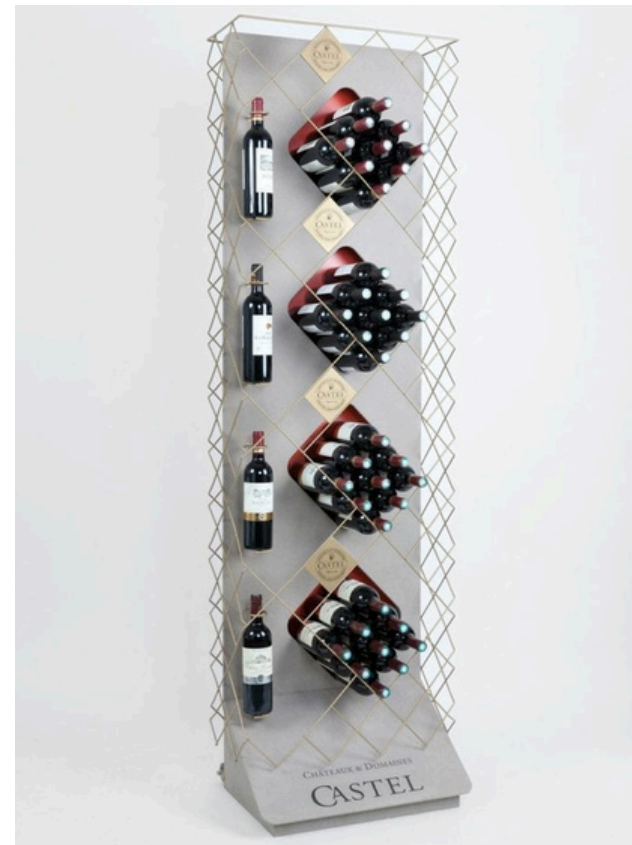
PLV Fabrication Française