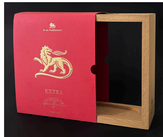
Cadre en chêne et fourreau carton