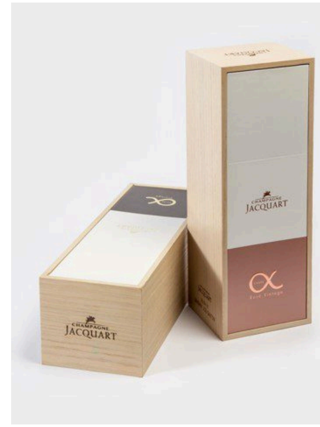
Coffrets bois / carton Fabrication Européenne