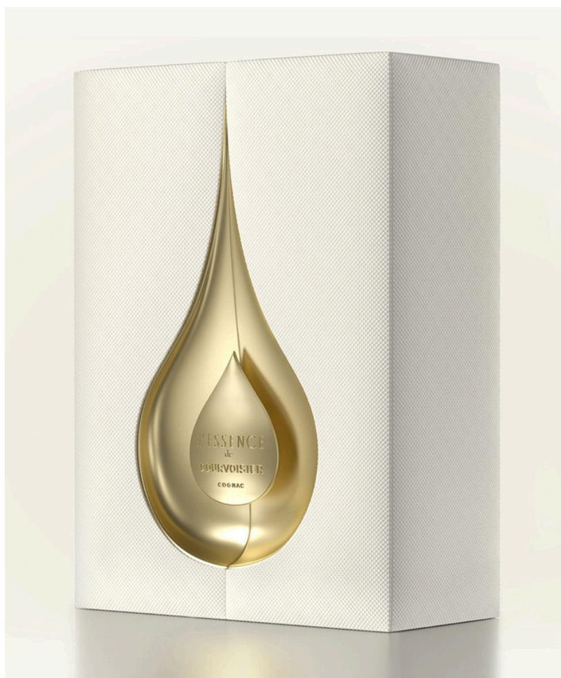
Métal embouti, gainage papier et laquage