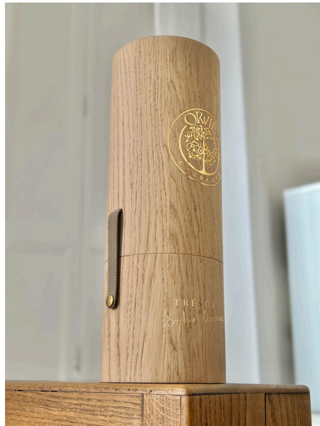
Coffrets bois Fabrication Française

Notre expérience, accompagnée de la réactivité, l'expertise et l'inventivité de notre équipe, nous permettent de créer et de développer pour nos clients des produits sur-mesure, quelque soit leur secteur d'activité.