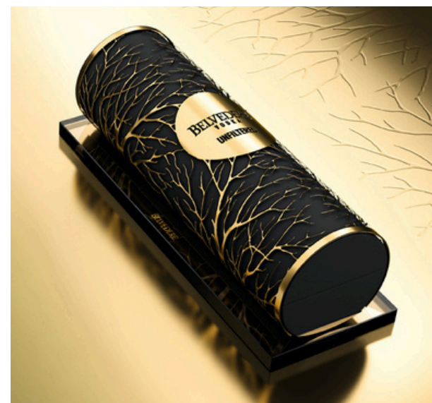
Métal ciselé et bois de bouleau