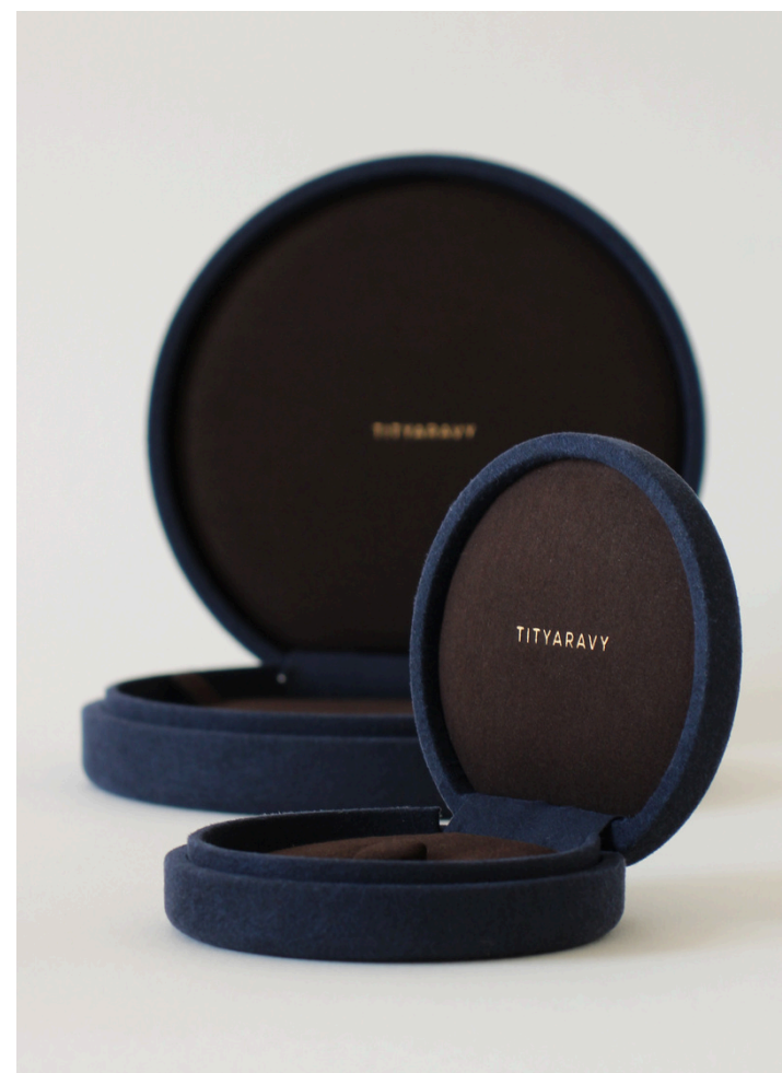
Impression 3D et gainage suédine