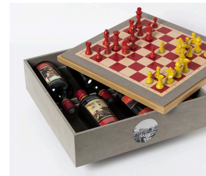
Valchromat gris et placage chêne