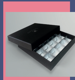
Coffrets à chocolats