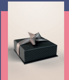
Ecrins à socle et ruban