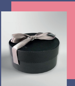
Boîtes rondes avec ruban