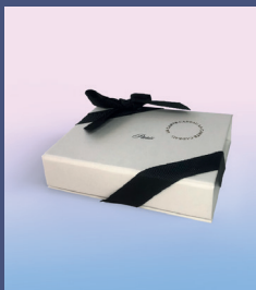
Ecrins pour carte-cadeaux