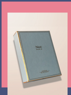
Finition liseré Or à Chaud