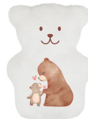
ma OURS SUB50