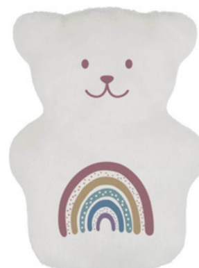
ARC EN CIEL SUB28