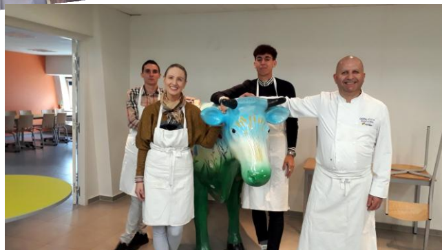
PREPARATION DU MIL FOURCHETTE