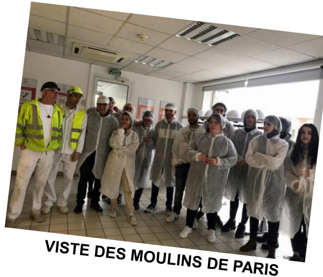
VISITE DES MOULINS DE PARIS