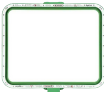
315 X 395 mm AX15