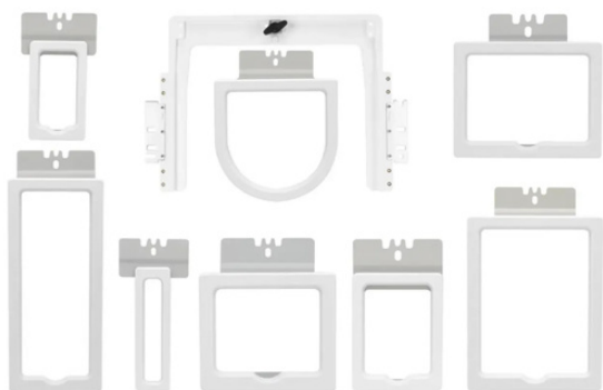
KIT BASTIDORES MAGNETICOS AX12 / AX15