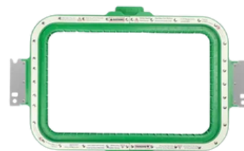
215 X 230 mm AX15