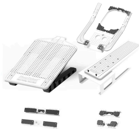
POSICIONADOR DE BORDADO HOOP TALENT AX12 / AX15