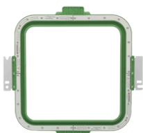
240 x 240 mm AX15