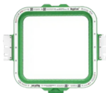
195 X 315 mm AX12, AX15