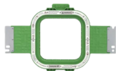
130 x 130 mm AX12, AX15