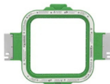
175 x 175 mm AX12, AX15