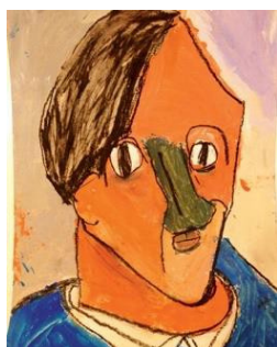
Louis 8 ans