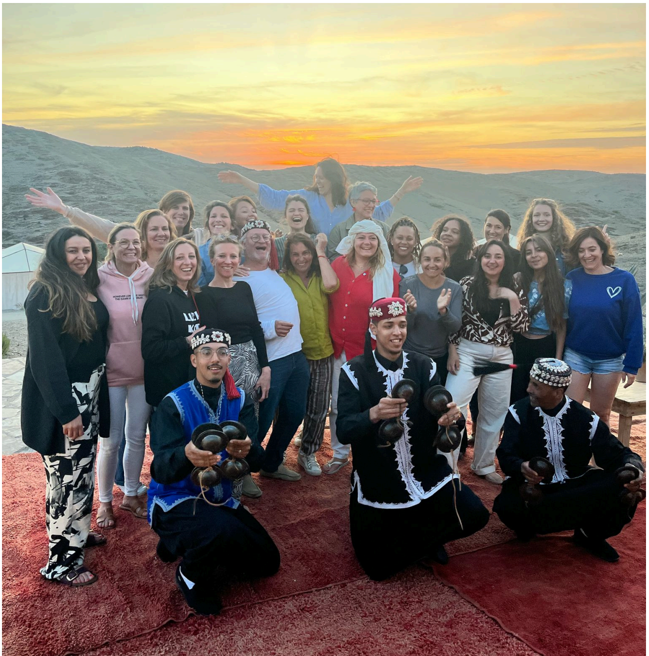
Seminaire 2025 - Marrakech

LA PETITE ACADEMIE propose des rendez-vous hebdomadaires en plus de son regroupement annuel. Nous proposons aux franchisés des réunions qui permettent de présenter les futurs projets du concept, les différents partenariats à venir. Ce sont des moments de formation, d'information, de rencontre et de partage pour les franchisés qui sont indispensables au bon développement du réseau.