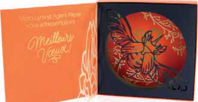
▲ Fourreaux L'ATELIER BÉLÉNOS