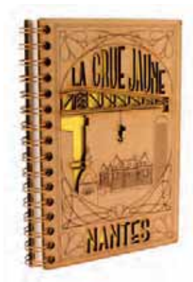
▲ Produits personnalisés LA GRUE JAUNE