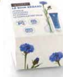
▲ Packaging et supports de communication YVES ROCHER