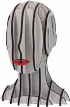
▲ Support lunettes SOLARIS