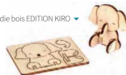
Goodie bois EDITION KIRO ▼