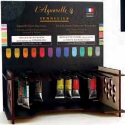
◆ Présentoirs bois SENNELIER / RAPHAËL