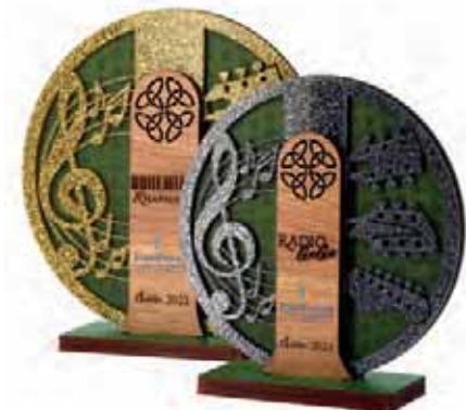
▲ Invitation et trophées IMPRIFRANCE