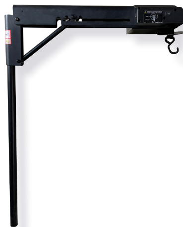
Mât / Potence