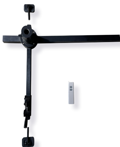
Base de fixation