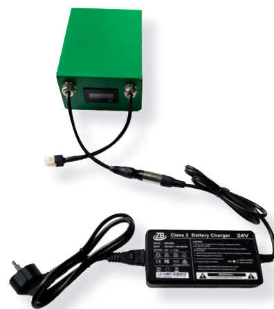
Batterie avion 10A ERGOCONCEPT et chargeur compatible