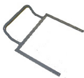
Arc de serrage